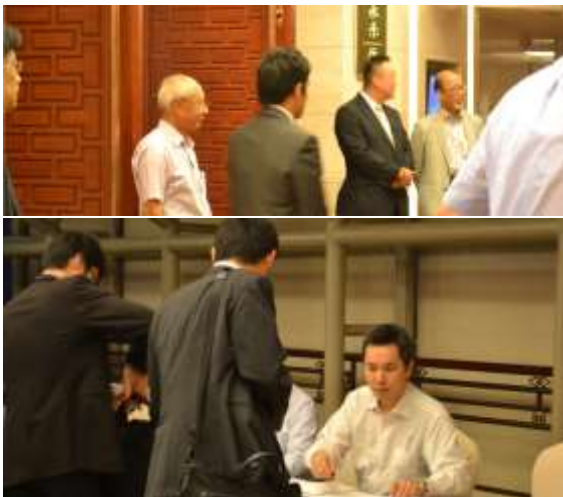
受付と会員を迎える理事達↓