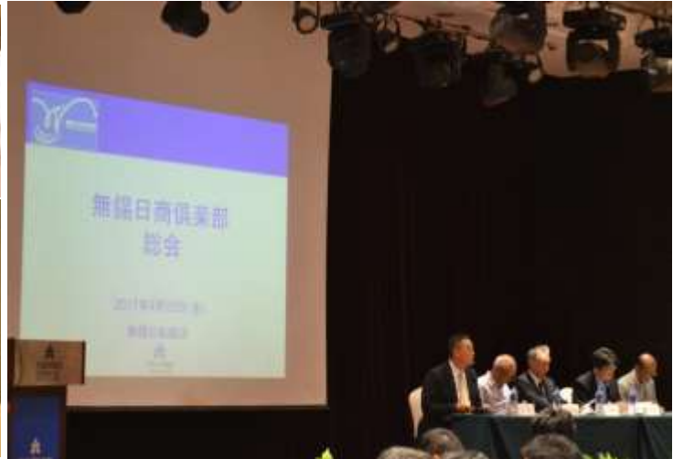
総会開始↓(会長、副会長着席)